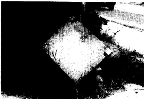
Fig. 2. 가스관-상수관 연결 shunt box.

외형적인 파손을 당한 것 이외에도 내부 회로도 가변저항이 타서 끊어진 상태였다. 이 상태에서 가스관 및 상수관의 전위는 다음과 같았다.