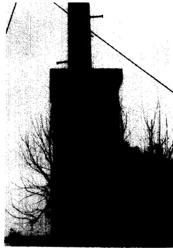
Fig. 3. 상수관 전기방식용 정류기.

저항의 크기가 0.5\Omega 일 때가 가스관의 전위가 상수관 전위보다 약간 높아 가장 적절한 상태를 유지할 수 있는 조건으로 판단되어 저항을 0.5\Omega